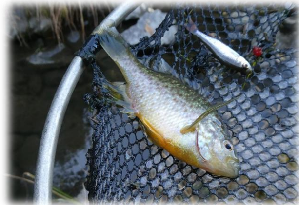
Persico sole, 28/10/2021