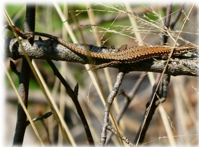
Lucertola muraiola, 20/5/2022