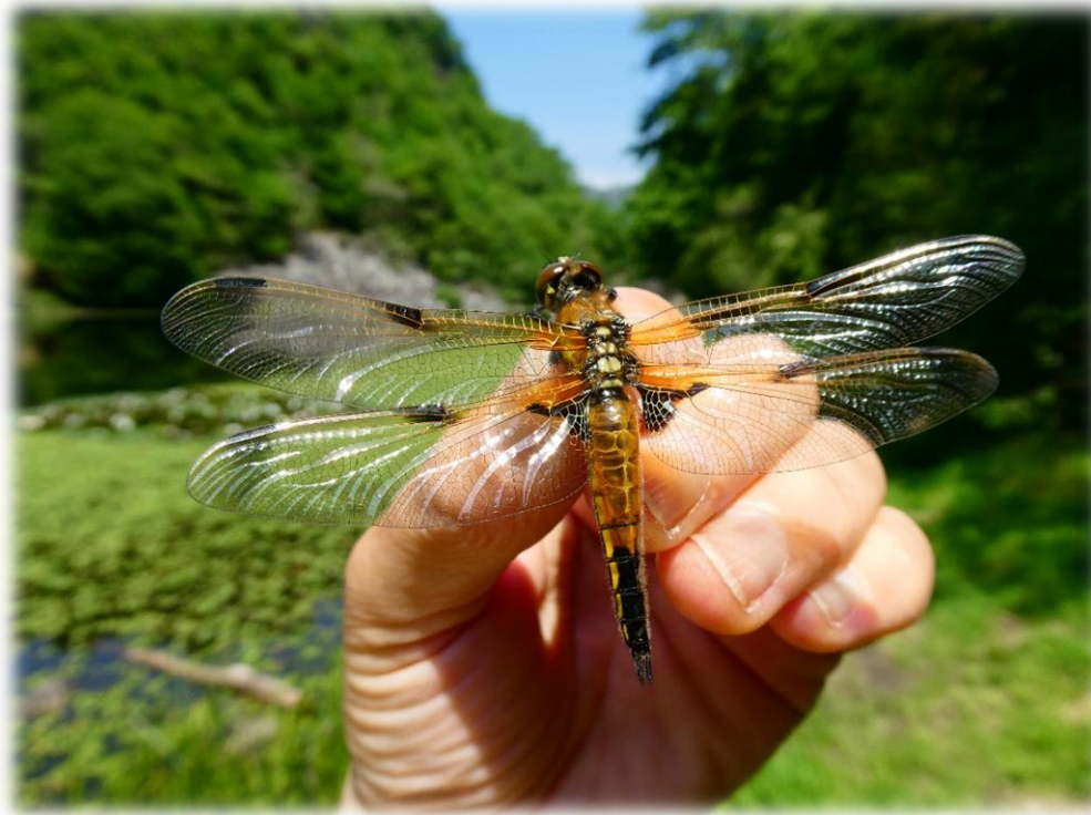
Libellula quadrimaculata, immaturo, 15/5/2022

Lucia Pompilio, Ente di Gestione delle Aree protette della Valle Sesia