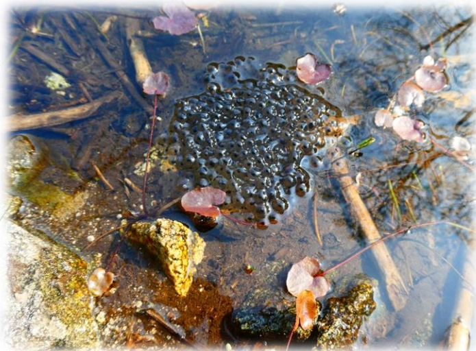
Ovatura di Rana Temporaria, 23/4/2021