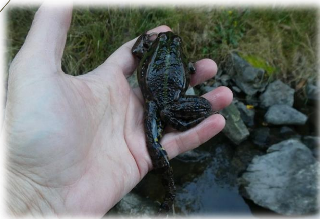
Rana verde, 28/10/2021